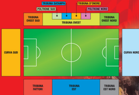
Piantina stadio e settori